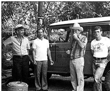
CON LA COMUNIDAD EN SAN FÉLIX